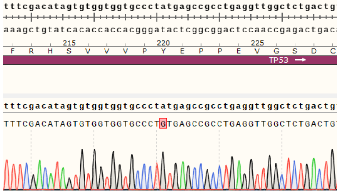
Fig 2. H_TP53(Y220C) BaF3 Cell Line 测序结果